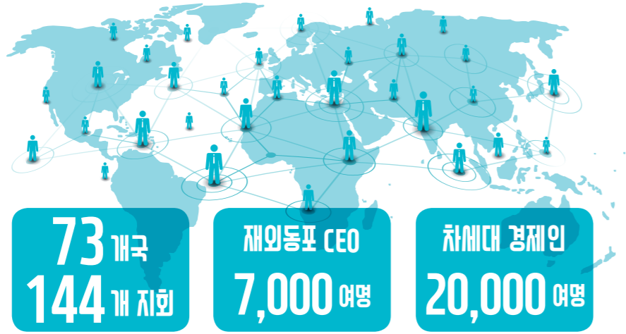
- 최대 재외동포경제인 단체 -

1981년에 설립되어 모국의 경제발전과 수출촉진을 위하여 활동해 오고 있으며, 750만 재외동포 중 최대의 한민족 해외 경제 네트워크