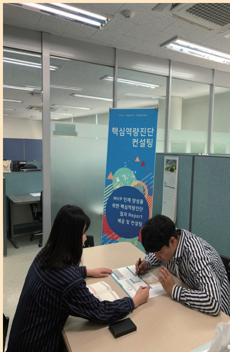
핵심역량 결과 학생(개인) 컨설팅

네, 교육성과관리센터에서는 핵심역량 진단 결과에 대해 개인별·학과별로 컨설팅을 진행하고 있습니다. 이러한 컨설팅을 통해 자신의 핵심역량 수준을 파악하고, 핵심역량을 함양할 수 있도록 지원하고 있습니다. 컨설팅을 원하시는 학생은 교육성과관리센터(3657)로 문의 바랍니다.