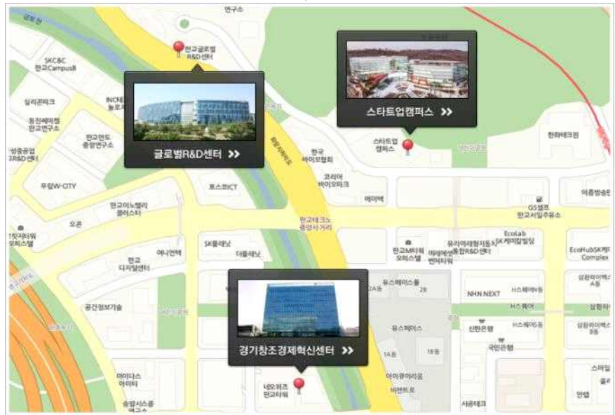
< 판교테크노밸리 내 공공지원시설 >