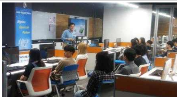
시설 안내 및 강의