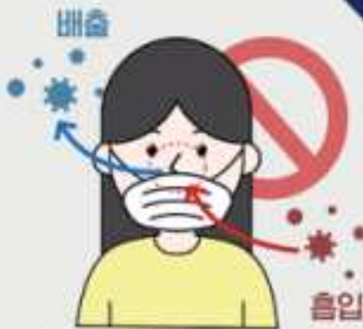
❶ 코가 노출되는 마스크 착용