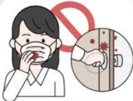
❸ 마스크 걸면을 만지는 행위