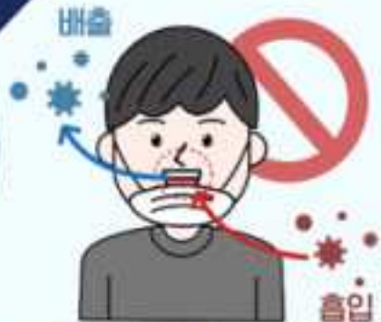
❷ 턱에 걸치는 마스크 착용