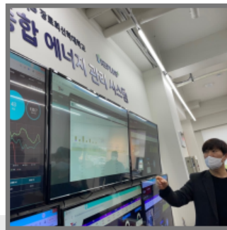
사)한국지속가능캠퍼스협회 소속 탄소중립 캠퍼스 우수사례 대학현장투어