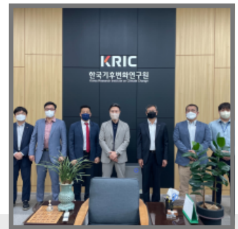
한국기후변화연구원 초청 방문