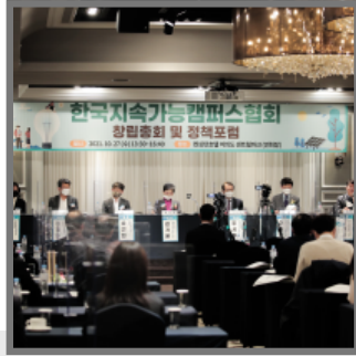
한국지속가능캠퍼스협회 창립기념 정책포럼