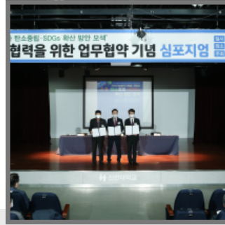
지속가능발전 협력을 위한 업무협약 전국지속가능발전협의회 · 한국지속가능발전학회 · 사)한국지속가능캠퍼스협회