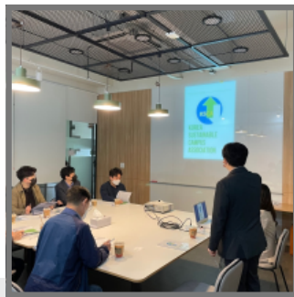
탄소중립캠퍼스 구축을 위한 설명회 협회 소속 대학 시설팀 관계자