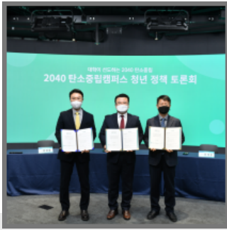
탄소중립캠퍼스 구축을 위한 업무협약 사)한국지속가능캠퍼스협회 · 대자연 · SDSN Korea