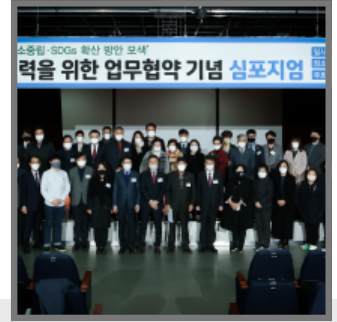
지속가능발전 협력을 위한 업무협약 기념 심포지엄