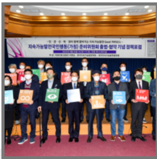
지속가능발전국민행동(가칭)준비위원회 출범 협약식 -민·관·학·정이 함께 열어가는 지속가능발전 Good 거버넌스-