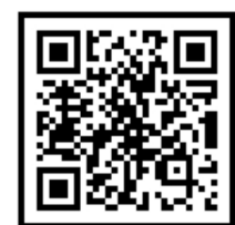
헌혈 앱 레드커넥트 (Android)

학교, 직장, 기관 등 20명 이상의 규모라면 단체헌혈 에 참여해 보세요.