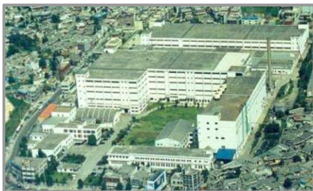
【옛 연초제조창 모습】