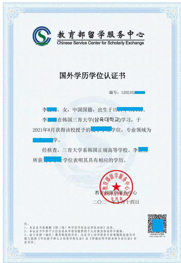
三育大学毕业证样式