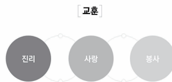
[ 삼육 인재상 ] 진리와 사랑의 봉사자

이상과 같은 우리 대학교의 교육적 사명을 두 마디의 비전으로 요약한다면 「 사람을 변화시키는 교육 」과 「 세상을 변화시키는 대학 」이라 할 수 있다. 우리 대학교는 이 비전에 담긴 대학의 이미지와 특색을 실현하기 위하여 학문의 수월성 교육은 물론이고 인성교육(人性教育) 을 강조하고, 지적·영적·신체적으로 균형진 발달을 도모하는 전인교육(全人教育) 에 선도적 역할을 해왔다.