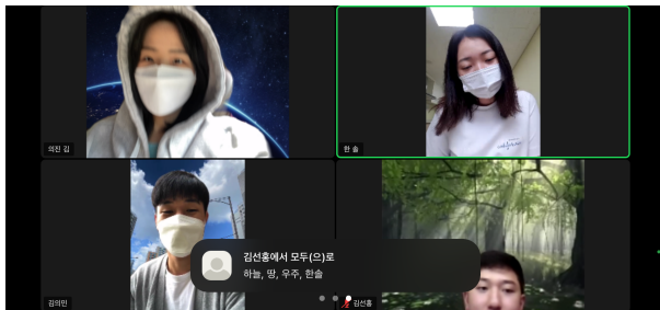
사진 1: 팀1-1