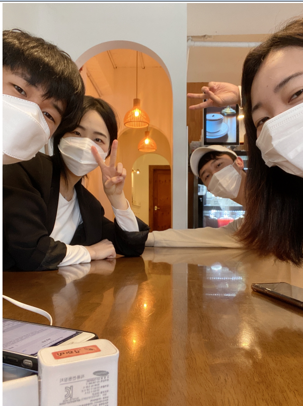
사진 1: 인물 사진 -1