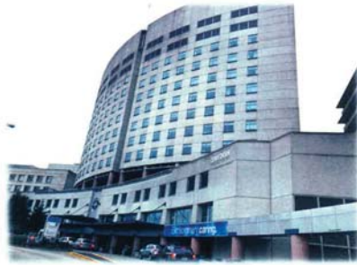
Swedish medical center