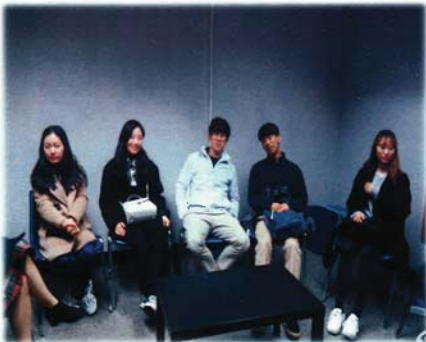
Bellevue branch 강의